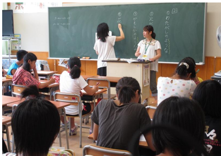
共通の問題を解いた後の一斉指導 ～大郷小学校～