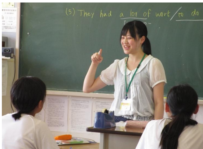
エガオでエイゴ ～大郷中学校～