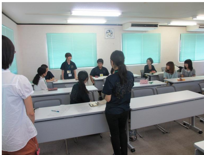
ボランティアに向かう前に本学生と鹿児島大生との交流会 ～岩沼事務所～