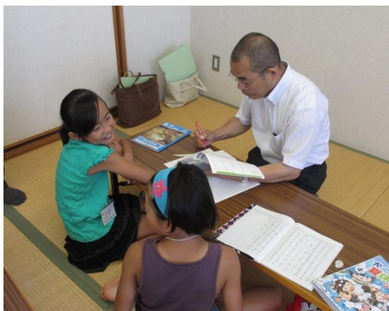
亀井教育長さんも真剣に ～くりはら塾～