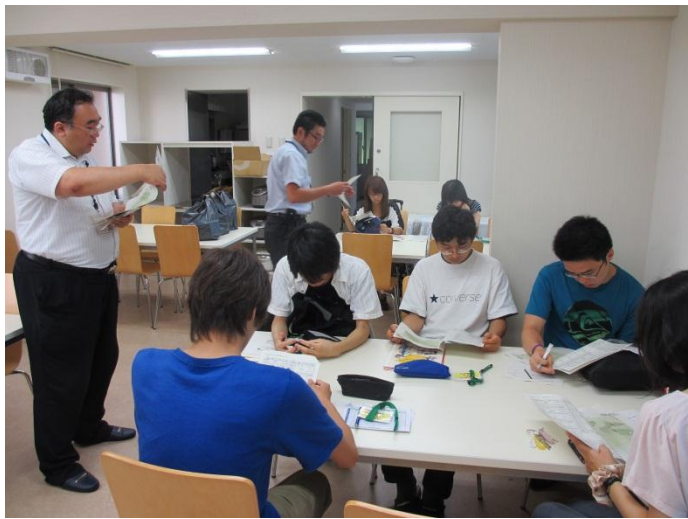
関上中学校に向かう早稲田大学生への事前指導 ～セミナーハウス～

その他、実施されるサマースクールの形態に触れ、学習支援ボランティアの在り方についても記されています。